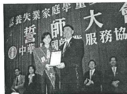
歌壇天后 張惠妹受邀擔任「認養失業家庭學童運動」親善大使