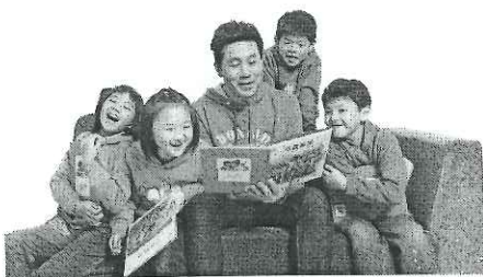
本土天王 羅時豐受邀擔任「認養失業家庭學童運動」親善大使