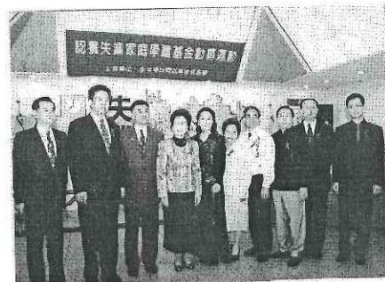
前總統 呂秀蓮女士參加「認養失業家庭學童運動」記者會